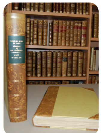
Journaux de voyage après restauration

La bibliothèque souhaite accélérer ce projet et faire restaurer et numériser la collection des Journaux de voyage dans son intégralité.