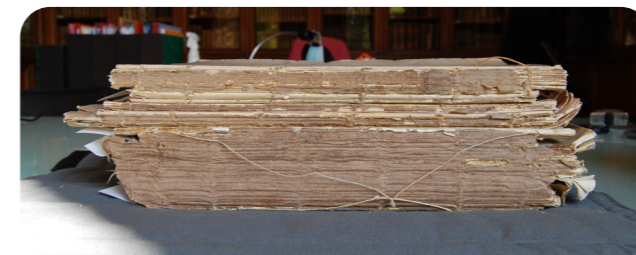
Journal de voyage avant restauration

La bibliothèque de l'École des Mines de Paris conserve un fonds d'environ 2300 Journaux de voyage manuscrits, rédigés par les élèves ingénieurs au XIX e siècle, à la suite de leur visite de sites industriels et miniers en France et à l'étranger. Ces journaux présentent un grand intérêt pour l'histoire des sciences et de l'innovation technique, grâce à leurs descriptions minutieuses et illustrées de procédés industriels observés sur le terrain.